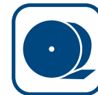
Pulpe et papier

Les robinets FluoroSeal® possèdent les meilleures caractéristiques de conception actuellement disponibles pour les robinets à tournants non lubrifiés. Ils sont inspectés durant tout le processus de fabrication, de la fonderie à l'assemblage final et à l'emballage afin d'assurer une qualité supérieure et une consistance dans chacune des unités. Tous les robinets sont éprouvés à la pression avant d'être expédiés afin d'être conformes aux essais de coquille ANSI B16.34 (DIN EN 12266-1) et aux exigences d'essais d'étanchéité MSS SP-61. Tous les alliages de nickel sont vérifiés à l'hélium par défaut.