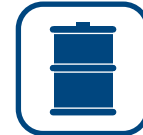
Pétrole et gas