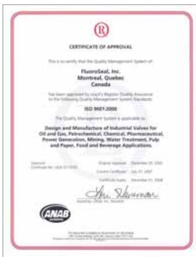
Certificat ISO 9001:2000