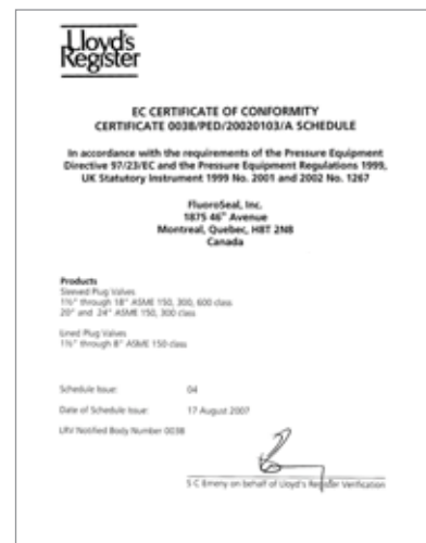
Certificat de conformité EC